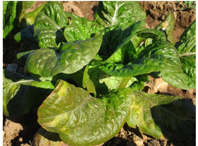
Figura 3. Síntomes de la infecció de míldiu en una varietat d'enciam tradicional.

A les taules de resultats, el període de collita indica de forma orientativa l'inici i el final de la collita, determinat en funció del vigor i la precocitat en el cabdellat de les varietats. Alhora es valora la resistència a l'espigat. El pes net (g) indica un valor orientatiu del pes comercial en el cicle de cultiu d'hivern i representa el pes en el moment òptim de collita (quan l'enciam ha cabdellat). La incidència de míldiu es va determinar durant les 3 collites, observant tant la incidència com la presència d'esporelació (Figura 3).