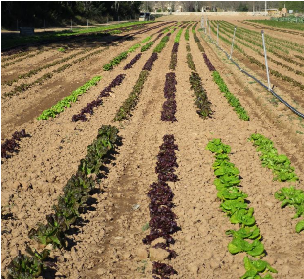
Figura 4. Vista de l'assaig a la Finca la Vall de Benifallet, Baix Ebre.