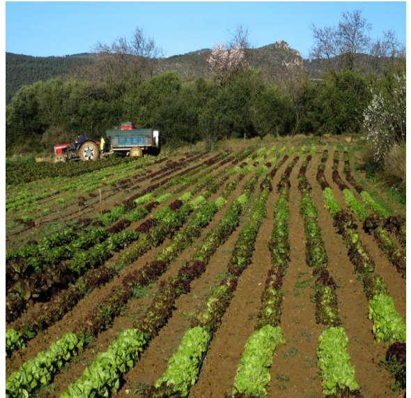
Figura 5. Vista de l'assaig a la finca de Rafa Mara a La Munia, Alt Penedès.